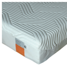
Tempur Original Supreme