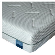
Jysk Gold F110